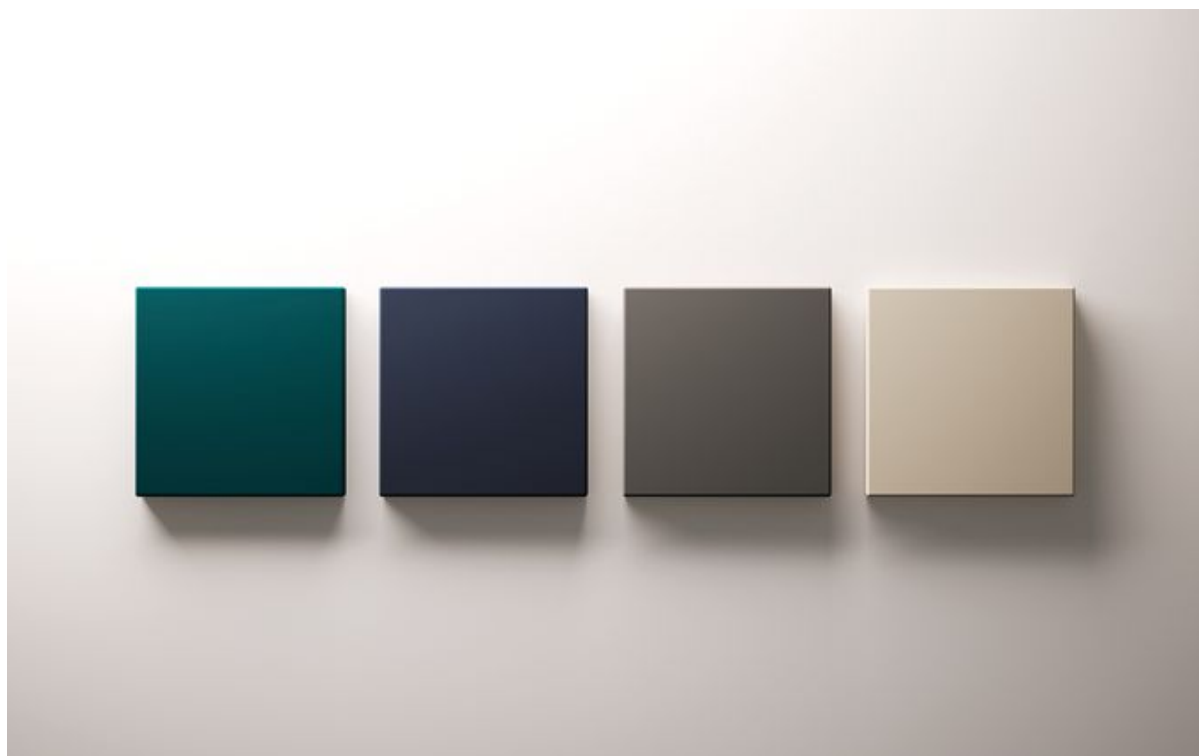
I nuovi colori: Evergreen, Cosmic Blue, Mink & Suede